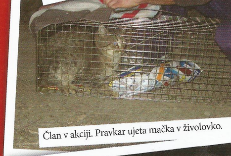
Član v akciji. Pravkar ujeta mačka v živolovko.