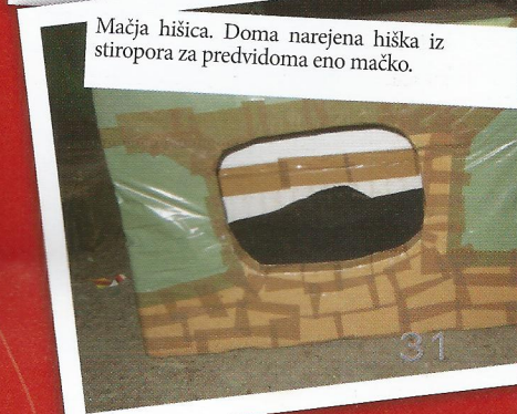
Mačja hišica. Doma narejena hiška iz stiropora za predvidoma eno mačko.